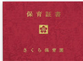
レザック表紙 (えんじ)

A4サイズ ¥490 (税込 ¥529) B4サイズ ¥740 (税込 ¥799)