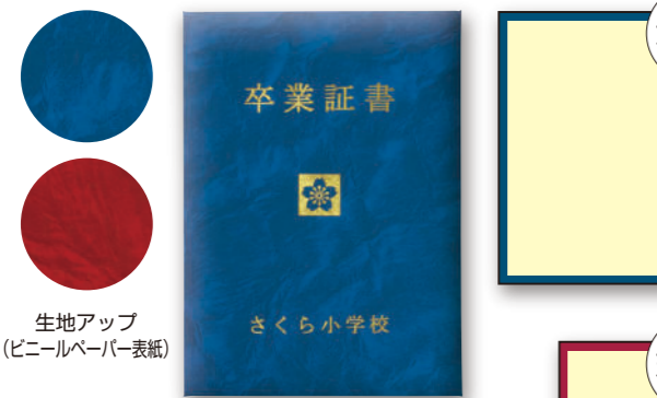
ビニールペーパー表紙 (紺)

高級感のある皮革調ペーパー貼り表紙を使用。両面パット入りで重厚感があり、汚れに強く、保管に便利な証書ホルダーです。