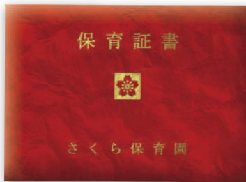
ビニールペーパー表紙 (えんじ)